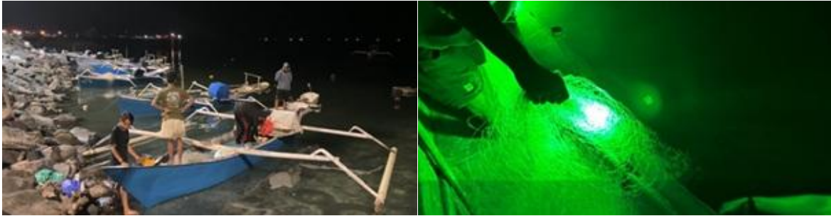
Gambar 5. Ujicoba teknologi lampu LED bawah air pada pengoperasian alat jaring insang hanyut

Uji-coba lampu LED pertama dimulai pukul 17.30 sore berangkat dari fishing base dan sampai di fishing ground pukul 18.10 wita. Setting of the drift gillnet began at 18.30 wita. Waktu yang sama, lampu LED bawah air diturunkan hingga jam 19.00 wita. Penarikan jaring ( hauling ) pertama dilakukan pada jam 22.00 dan hauling kedua dilakukan pada jam 04.00 wita. Selama jaring direndam dilakukan pengamatan tanda-tanda kedatangan ikan dibawah lampu serta pengamatan arus dan gelombang. Selama proses itu, kondisi oseanografi cukup ekstrim sehingga tidak ada ikan yang datang berkumpul di sekitar sumber cahaya lampu LED bawah air.