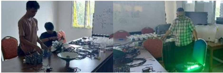
Gambar 2. Disain dan perakitan lampu LED di Laboratorium Teknologi Penangkapan Ikan UNHAS

Prosedur pembuatan lampu LED bawah air disajikan sebagai berikut dan digambarkan secara visual pada Gambar 3 di bawah ini.