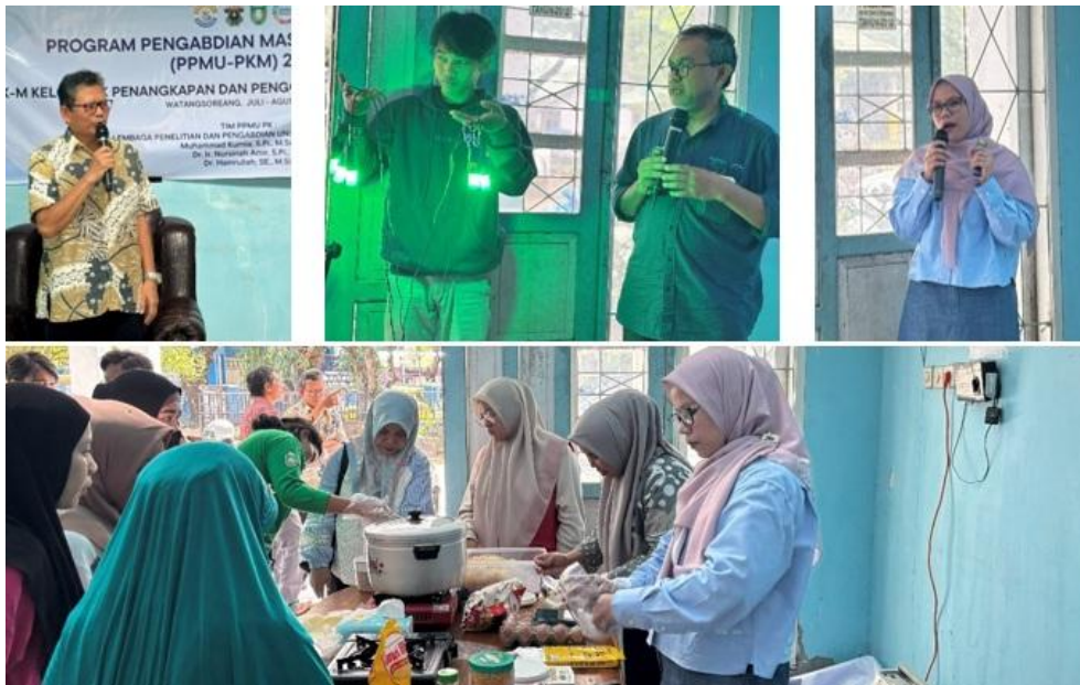
Gambar 4. Dokumentasi kegiatan bimbingan teknis dan pendampingan mitra

nelayan[10]. Lebih lanjut dijelaskan bahwa penerapan teknologi yang tepat mampu mengembangkan usaha perikanan yang lebih tangguh, berdaya saing tinggi, dan peningkatan produktivitas usaha yang lebih modern.