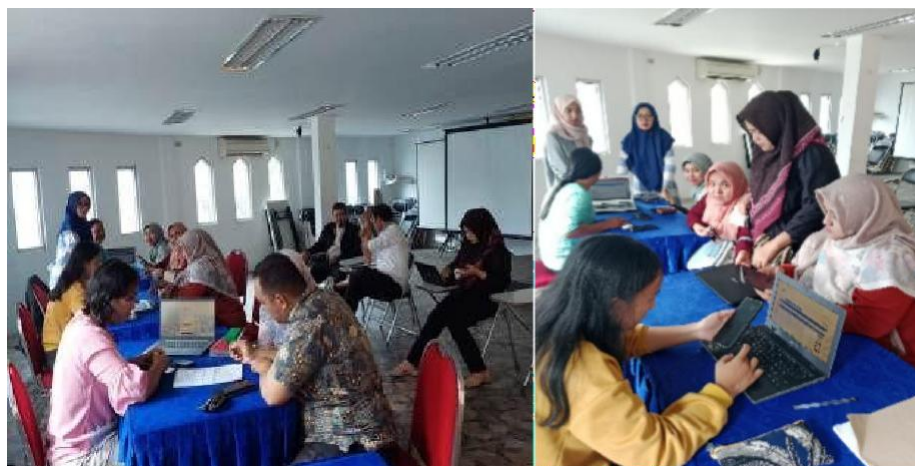
Gambar 1. Kegiatan Asistensi dan Dan Edukasi Tax Center UPBI

Selain layanan asistensi, tim dosen juga berperan memberikan pengarahan teknis dan motivasi kepada mahasiswa relawan agar mampu berkomunikasi efektif dan menjaga etika pelayanan publik. Mahasiswa yang sebelumnya telah mengikuti bimbingan teknis (Bimtek) menunjukkan peningkatan kemampuan dalam memahami peraturan perpajakan dan aplikasi e-Filing.